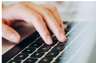
Conteúdo: Assessoria de Imprensa/NCI Responsável: Ângelo Medeiros - Reg. Prof.: SC00445(JP)

Com a implementação deste novo módulo, a emissão das certidões se tornará mais eficiente, de forma a contribuir para a melhoria da qualidade dos serviços oferecidos a todos pela Justiça Catarinense.